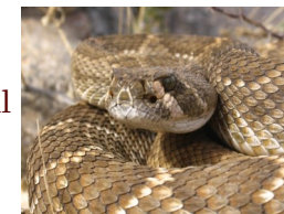
Elaboró: Crystian S. Venegas Barrera

División de Estudios de Posgrado e Investigación Teléfono: (834) 153-2000 ext 325 Página: http://www.itvictoria.edu.mx/oferta/m_biologia.html Correo electrónico: posgrado.biologia@itvictoria.edu.mx Dirección: Boulevard Emilio Portes Gil # 1301 C.P. 87010 Colonia J. López Portillo Ciudad Victoria, Tamaulipas